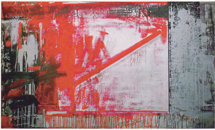
OIL COLOR W:1620mm X H:970mm 2005